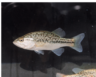
77. ブラックバス (オオクチバス)